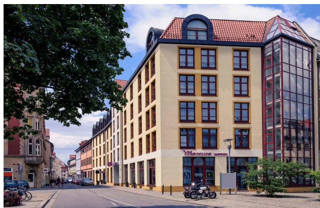
Mercure Hotel Erfurt Altstadt