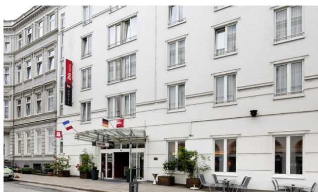
ibis Hamburg Alster Centrum

FOCUS TRAVEL AB Postadress Box 300 551 15 Jönköping Org nr 55 62 69-4066